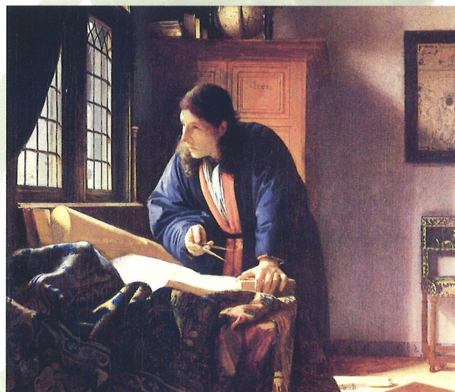
« Le Géographe », Johannes Vermeer, 1669, Städtisches Kunstinstitut, Francfort-sur-le-Main (Allemagne).

Ainsi se développe une intelligence collective pour résoudre ensemble les difficultés propres à l'éducation et à l'enseignement et répondre avec bonheur à la mission de nos établissements.