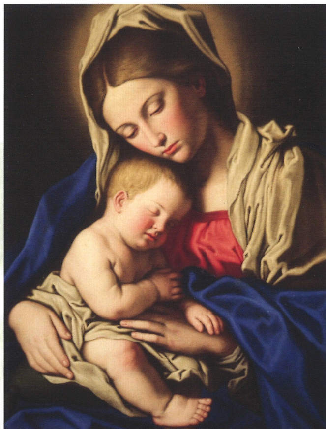
« Vierge à l'enfant », Giovanni Battista Salvi, v. 1640, Pinacothèque municipale de Cesena (Italie).

Un climat de confiance, d'espérance dans les capacités de chacun crée une ambiance paisible, qui favorise la paix intérieure de celui qui se sait aimé et accompagné, la sérénité dans les relations mutuelles.