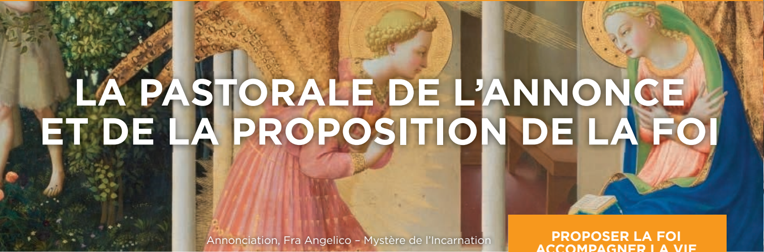
Annunciation, Fra Angelico – Mystère de l'Incarnation